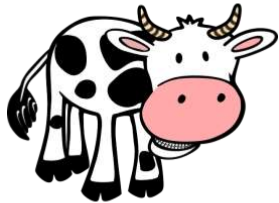
Příloha č. 6 - kráva: