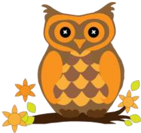
Příloha č. 7 - sova :